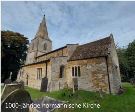
1000-jährige normannische Kirche

Wir wurden von den Ältesten herzlich in der mit Erntegaben geschmückten Kirche empfangen. Der Gottesdienst wird anders als bei uns gehalten. Eine Liturgie gibt es nicht. Bei Gebeten sitzt man, beim Singen