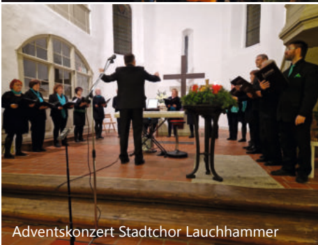
Adventskonzert Stadtchor Lauchhammer