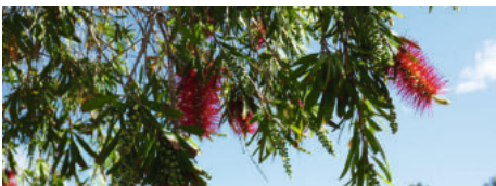
01.03.24 18 Uhr Weltgebetstag in Nermsdorf

09:00 Uhr Krautheim 10:30 Uhr Buttelstedt 14:00 Uhr Leutenthal