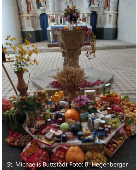
St. Michaelis Buttstädt

Die Lebensmittelpenden wurden an die Tafeln Buttstädt und Apolda gegeben, wofür die Empfänger herzlich danke sagen möchten. Also recht herzlichen Dank an alle, die gespendet haben mit den Worten aus der Bibel: „ Gott liebt den, der fröhlich gibt. “ 2. Korinther 9,7