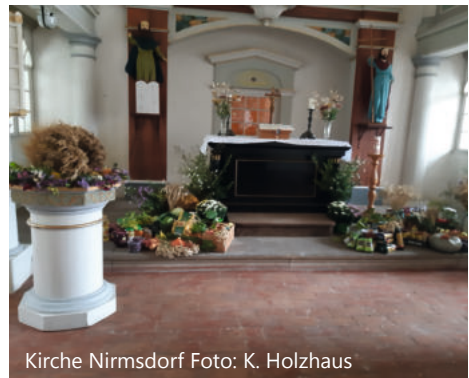
Kirche Nirmsdorf