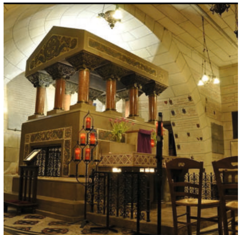
Grabmal des Heiligen Martin in Tours

Quellen: Karin Holzhaus, Vivat-Magazin, Wikipedia